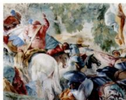
5 – Part. dell'affresco di De Mura nel Salone

La facciata del palazzo originario, pur condizionata dalla stretta strada, era nella sua eleganza rinascimentale caratterizzata dalla sovrapposizione degli ordini architettonici su un alto basamento rettilineo in piperno, oggi compromesso dall'apertura di alcune botteghe e dalla manomissione del portale, che era costruito da un'arcata trionfale tra le due colonne ioniche, tipicamente 'mormandeo' come quelli di via Tribunali 231, via San Giovanni Maggiore Pignatelli 29, e nel cortile del palazzo del Panormita a via Nilo.