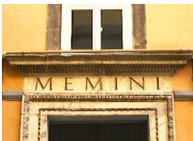
4 – Part. dell'ingresso nel cortile