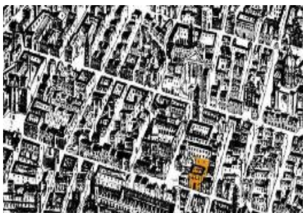
1 – Part. Mappa del Baratta – sec. XVII

Questo palazzo, tuttora privato, secondo Roberto Pane "vanta la pi elegante facciata rinascimentale di Napoli, anche se le sale interne non conservano quasi nulla della primitiva forma, perché rifatto in età barocca".