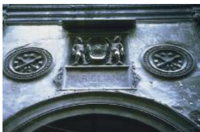
3 – Part. del frontale su Via San Biagio

La giusta attribuzione al Mormando fu merito di Bartolomeo Capasso che nel '900 poteva confermare l'esatta paternità, già attribuita al Mormando da qualche studioso per motivi stilistici, attraverso un documento d'archivio con cui gli eletti della città concedevano la licenza a Bartolomeo di Capua "... secondo lo disegno età consiglio de mastro Johann Mormando architetto".